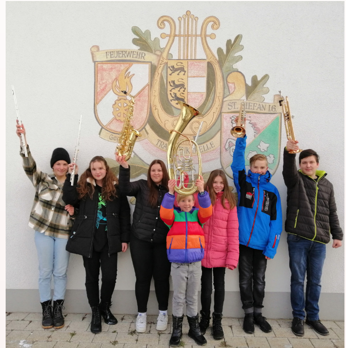
Ein Teil unserer erfolgreichen Jungmusiker